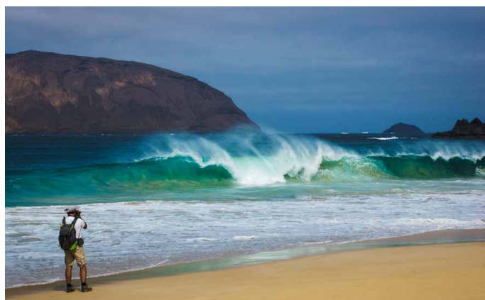
Fotografieren an der Küste von Playa de las Conchas