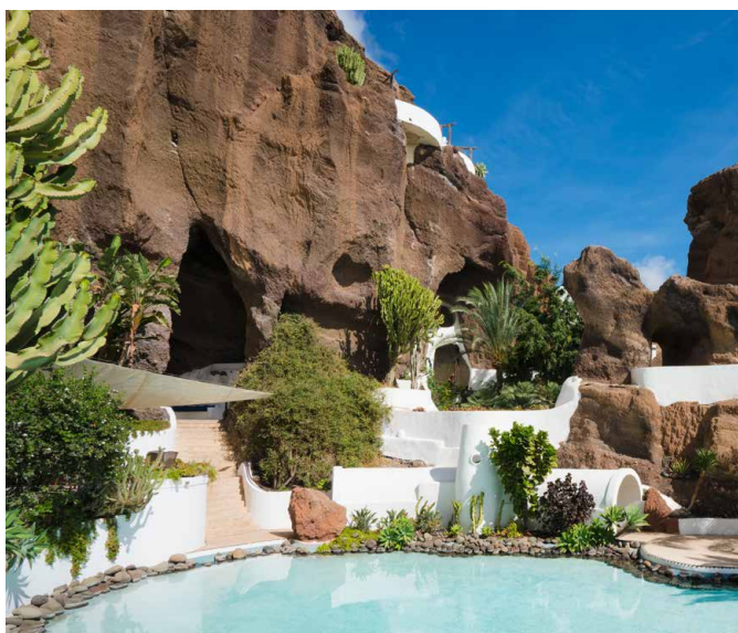
Lagomar - Wohnen im Vulkan

Fahrt zum Flughafen und Rückflug in die Schweiz.