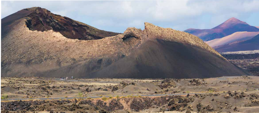
Links: Vulkan El Cuervo vor Timanfaya / rechts: Blick auf Vulkan Montaña Amarilla, La Graciosa