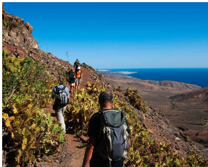
Die spärliche Vegetation besteht aus Opuntien und Nicotiana Glauca

Dauer der Wanderung: 3 Std. (11 km), Höhendifferenz: + 250m; - 400m