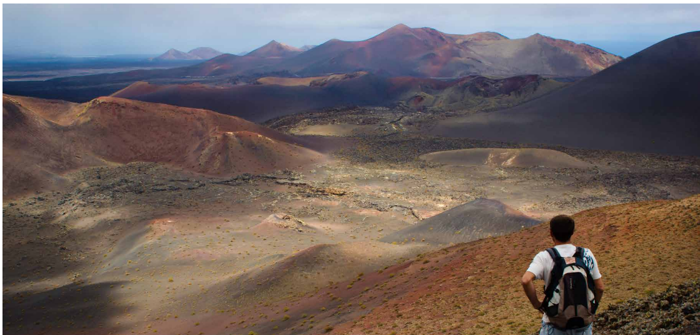
Wanderer in Timanfaya